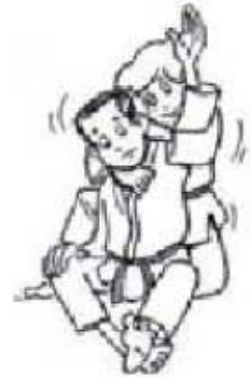
KATA HA JIME