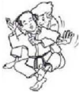
OKURI ERI JIME